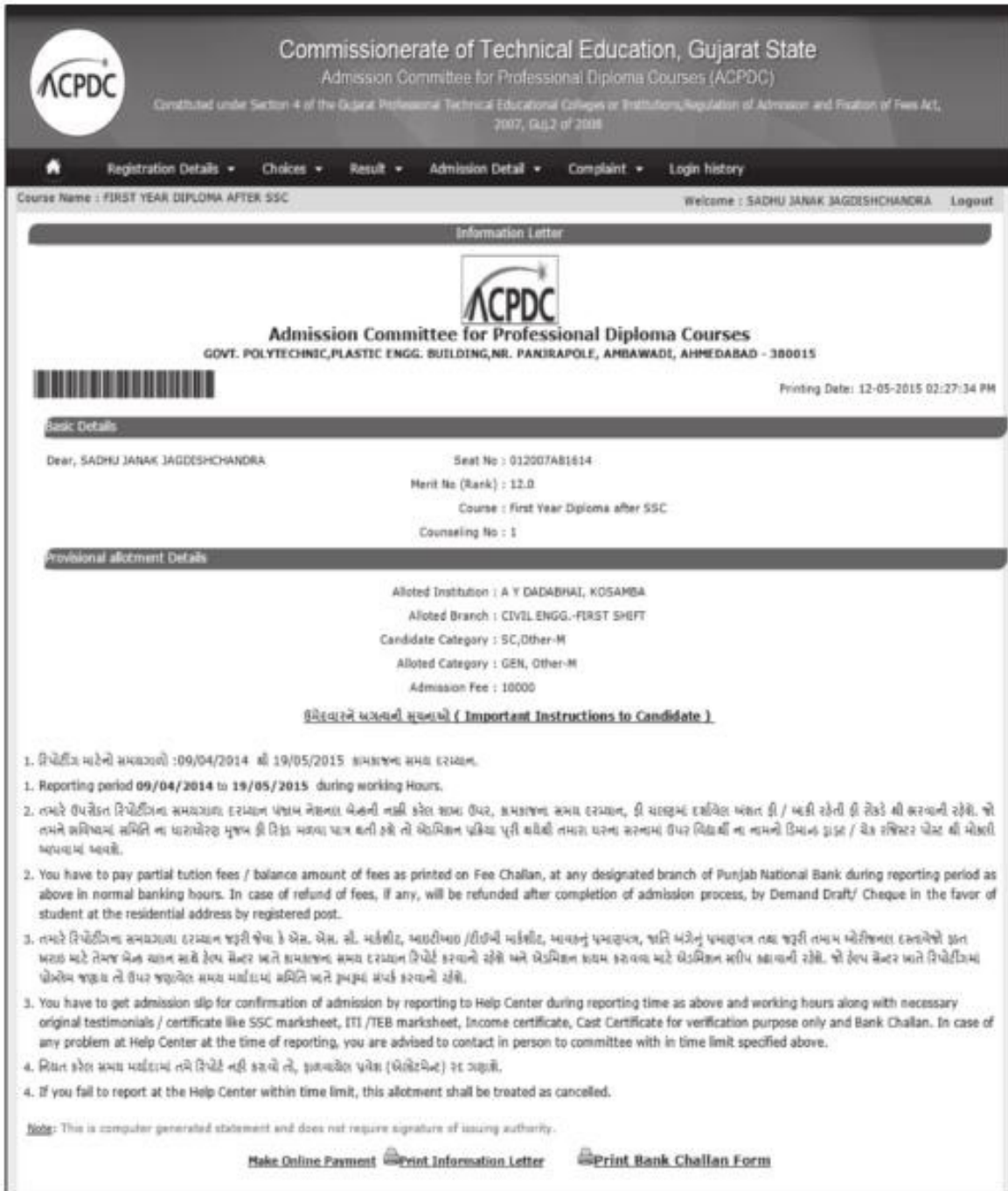
Fig. 3.15 Screen of "Information Letter"