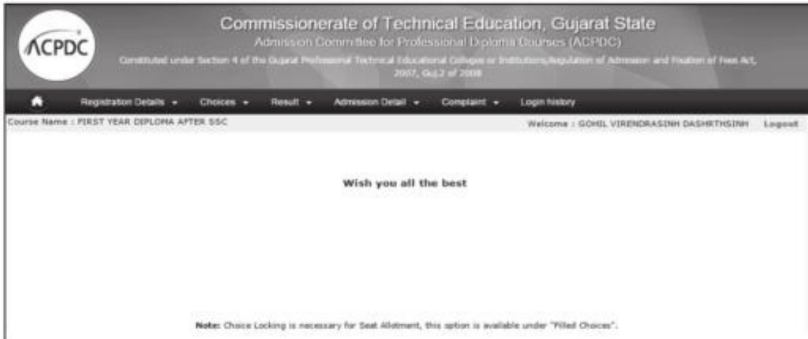
Fig 3.10 Screen of "Welcome"