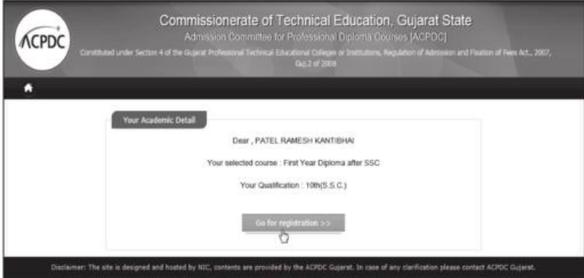
Fig 3.4 Screen of "Your Academic Detail"