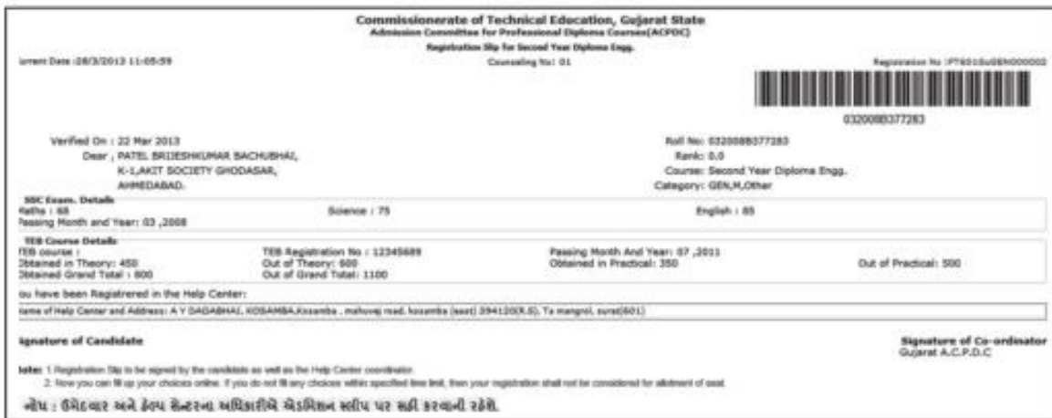
Fig 3.9 "Registration Slip"