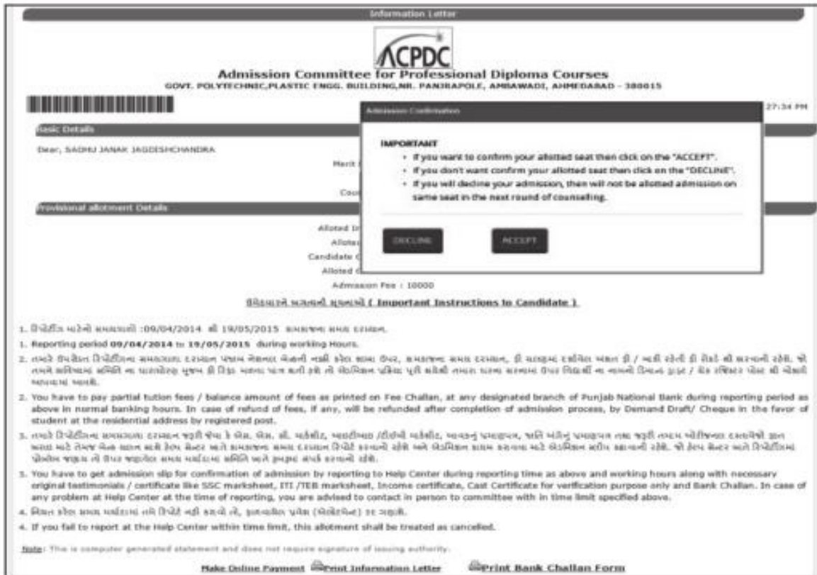
Fig. 3.17 Admission Confirmation in case of "Zero Fee"